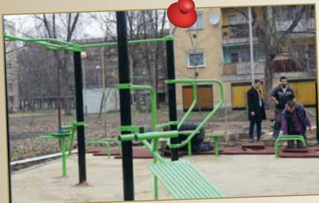
Kültéri kondi parkot hoztunk létre az Október 23-a téren, mely délutánonként megtelik fiatalokkal, akik itt edzenek. Folytatjuk a terület további fejlesztését!

Mint azt a Kedves Olvasók megszokhatták, az Önkormányzati Hírek újságban minden év végén visszatekintünk a magunk mögött hagyni készülő esztendőre. Most, rendhagyó módon, az elmúlt 5 év eredményeiből, értékes pillanataiból válogattunk, melyet évenkénti lebontásban, 5 lapszámon keresztül mutatunk be. 2017-ben is rengeteg fejlesztés történt, sok felejthetetlen rendezvényen vehettünk részt, melyek közös sikereink és melyekre azt mondjuk: FOLYTATJUK!