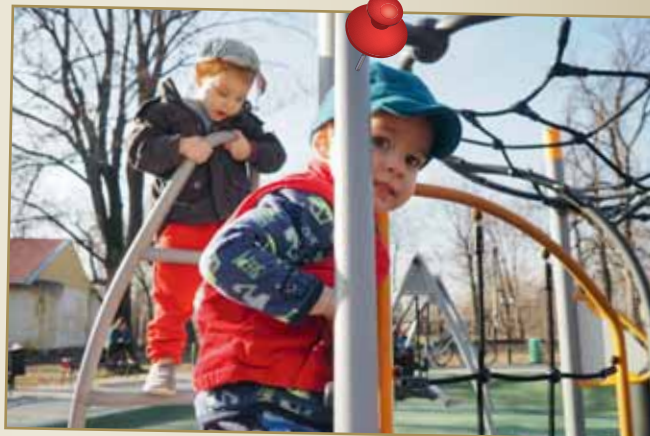
Megújult Nagykörös szíve, a Cifrakert 2017-ben. Az egyik legnagyobb sikert az új, modern játszótér érte el, mely gyorsan a gyermekek kedvence lett