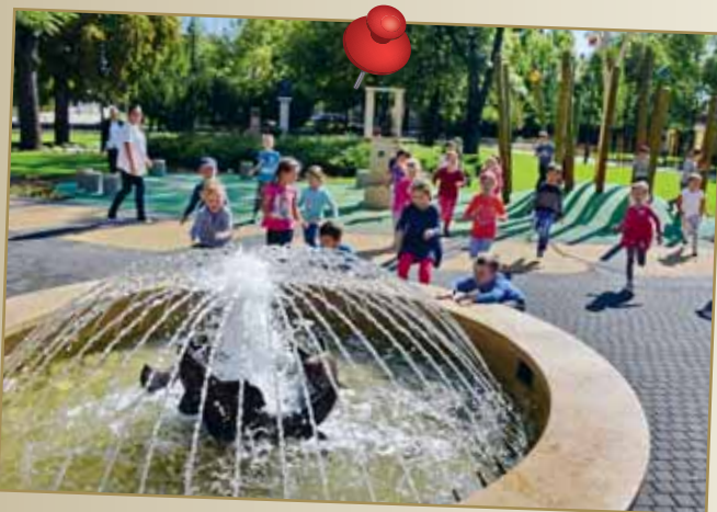
Teljesen felújítottuk Nagykörös fő terét, a Hősök terét, mely új köztéri alkotásokkal, ivókúttal, játszószigettel és megújult köztéri illemhellyel gazdagodott. A járhatatlan vörös salak helyére térkő került