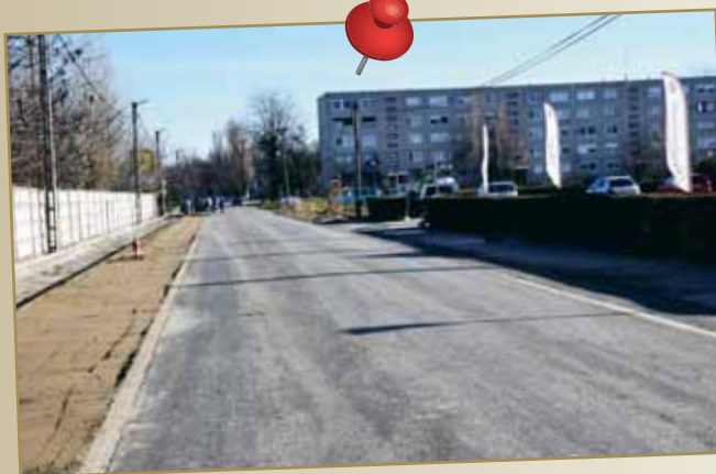
Ellenzéki propaganda, hogy csak a városközpont fejlődik. Teljesen felújítottuk a Téglagyári utat, az ipari park kényelmes megközelíthetősége érdekében. Járda és bicikliút is létesült, hogy az ott dolgozók, arra lakók munkába járását, közlekedését segítsük