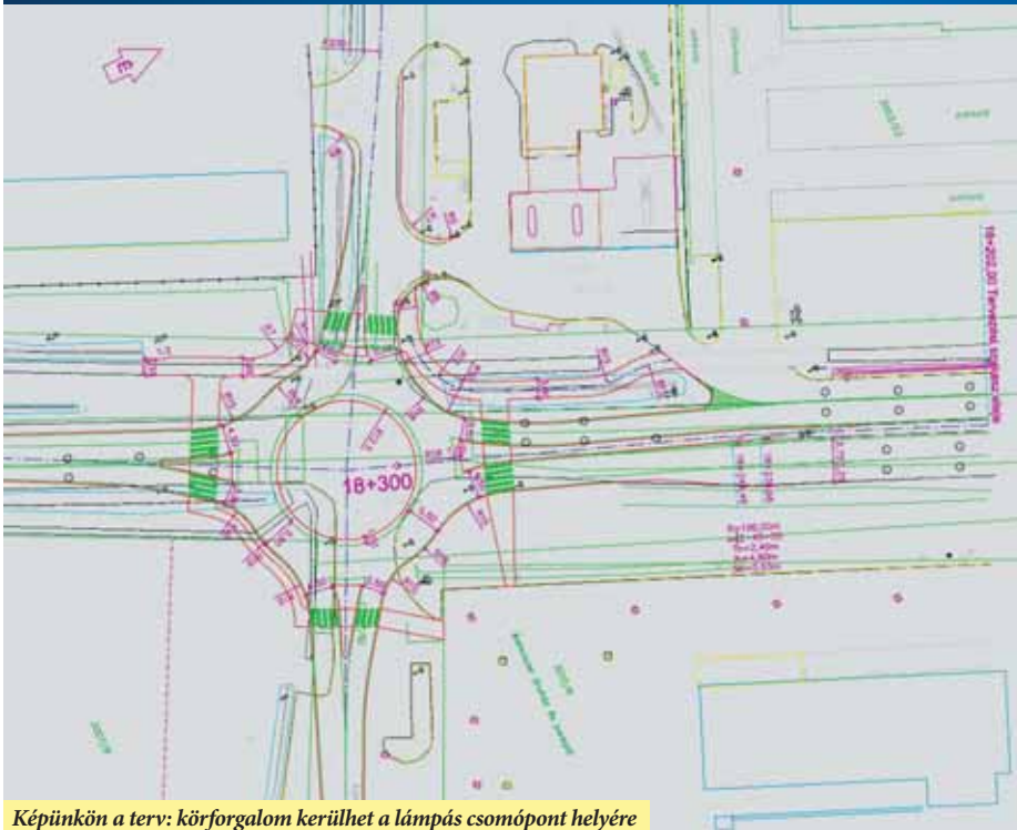
Képeinken a terv: körforgalom kerülhet a lámpás csomópont helyére

Végre elmondhatjuk, hogy valóban jól halad a 441-es út Kecskemét-Nagykőrös közötti szakaszának tervezése. Korábban már több alkalommal egyeztettek személye-