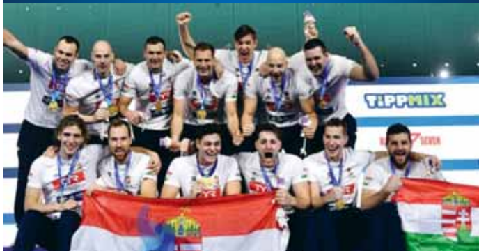
A magyar válogatott játékosai ünneplik győzelmüket

A magyar válogatott nyerte a Duna Arénában rendezett vízilabda Európa-bajnokság férfitorneját: Márcz Tamás együttese a vasárnapi döntőben, drámai csatában, ötméteresek után 14-13-ra győzte le a világbajnoki ezüstérmes spanyol csapatot.