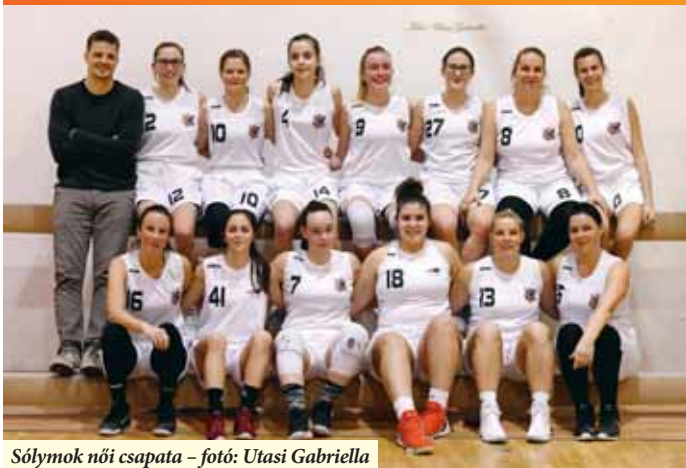
Sólymok női csapata

Az elmúlt héten nagy várakozás előzte meg a juniorok mérkőzését, mely január 22-én igen fájó eredményt hozott a Nagykőrösi Sólymok KE számára. Az U18-as csapat, a hazai pályán kiharcolt tetemes előny ellenére alulmaradt a Dombóvár elleni párharcban, így nem jutott az ország legjobb 16 csapata közé. Ám azért, hogy idáig is eljutot-